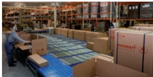
Poste d'expédition ergonomique: les accessoires et les matériaux d'emballage toujours à portée de main.

Les conditions de travail ont été optimisées: chariots et engins de levage pour éviter la manutention des charges lourdes, hauteurs de travail variables pour ménager le dos, matériaux d'emballage toujours à portée de main, lampes à économie d'énergie type lumière du jour à la place des néons. Les conditionnements en bois sont remplacés par une base de cartons ondulés multicouches, d'assemblage rapide, sans clous ni agrafes. Avantage notable pour le destinataire par la facilité de déballage et de recyclage. Avec ses 1.400 m 2 , le service expédition a quasiment doublé de surface. Les rayonnages de grande hauteur ont une capacité de plus de 2.000 étuves prêtes à être expédiées. On y entrepose également les matériaux de conditionnement ainsi que les pièces de maintenance et de rechange.