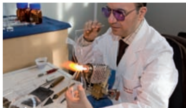
Voor't Labo possède son propre atelier de verrerie pour le laboratoire Voor't Labo cuenta con su propia vidriería para el instrumental de laboratorio