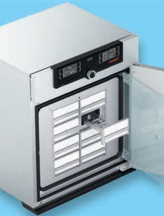
IVF-Modul für ICO105med