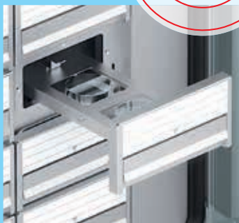
Minimale Erholzeit durch Kultivierung der Petrischalen in separaten Schubladen